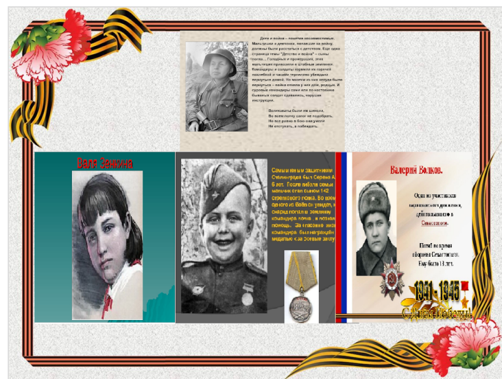
отличная газета — АНОНИМНЫЙ

За боевые заслуги в годы Великой Отечественной войны десятки тысяч детей и пионеров были награждены орденами и медалями. К мирной жизни подросшие сыны полка возвращались нелёгкими дорогами войны!