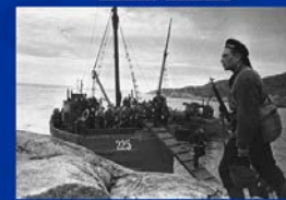
Великая Отечественная война. Фотохроника. Северный флот