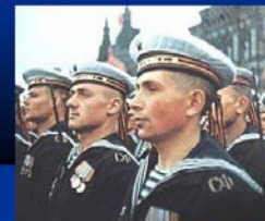
Советские морские гвардейцы СФ на параде Победы, 1945 год.

В ходе войны в задачи флота входило прикрытие приморского фланга 14-й армии от вражеских десантов и обстрелов кораблей, защита своих путей морского сообщения и удары по коммуникациям врага, нарушавшие транспортные перевозки противника и лишавшие его инициативы на море. Противостоя крупным силам противника, флот за годы Великой Отечественной войны уничтожил свыше 200 боевых кораблей и вспомогательных судов, более 400 транспортов общим тоннажем свыше 1 миллиона тонн, около 1 300 самолетов врага