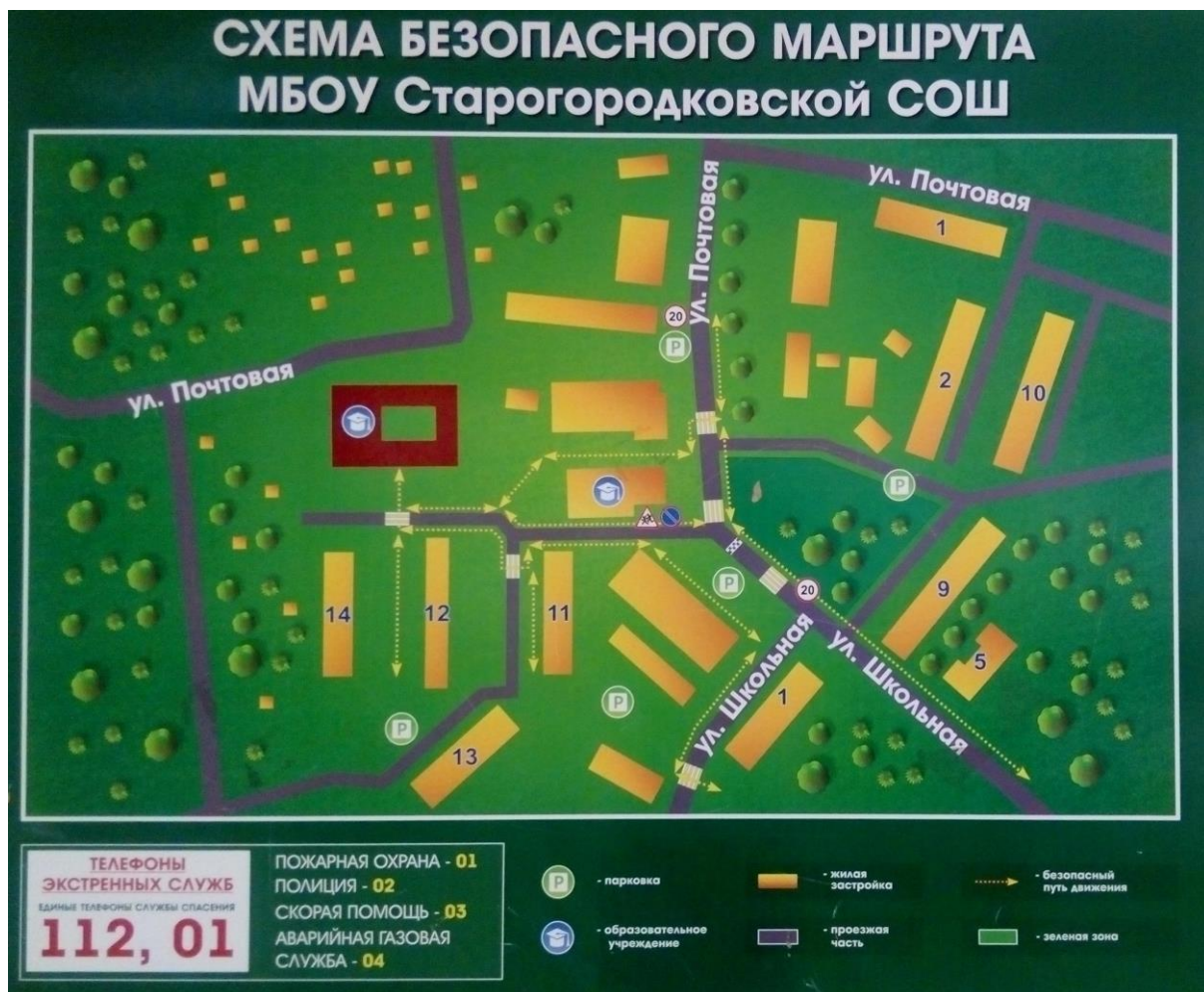
Стенды по дорожной безопасности, размещённые в МБОУ Старогородковской СОШ