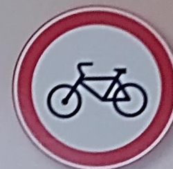
“ДВИЖЕНИЕ НА ВЕЛОСИПЕДАХ ЗАПРЕЩЕНО”

• Если для велосипедистов установлены специальные светофоры, то такой перекресток называется регулируемым .